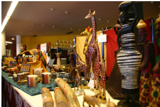
Nima e.V. Afrika-Basar

Auch in diesem Jahr präsentieren unsere „Nima e.V. Nachwuchsmodels“ wieder die neueste ghanaische Mode. Im Anschluss an die Kindermodenschau können die vorgeführten Kleider und noch viele mehr am Verkaufsstand unseres Afrika-Basars erworben werden. Außerdem stehen exotische Holzschnitzereien in Form von Masken, Figuren, Schüsseln und Besteck, ausgefallene Perlenketten sowie selbst genähte Taschen, Kissen, Tischsets, usw. zum Verkauf.